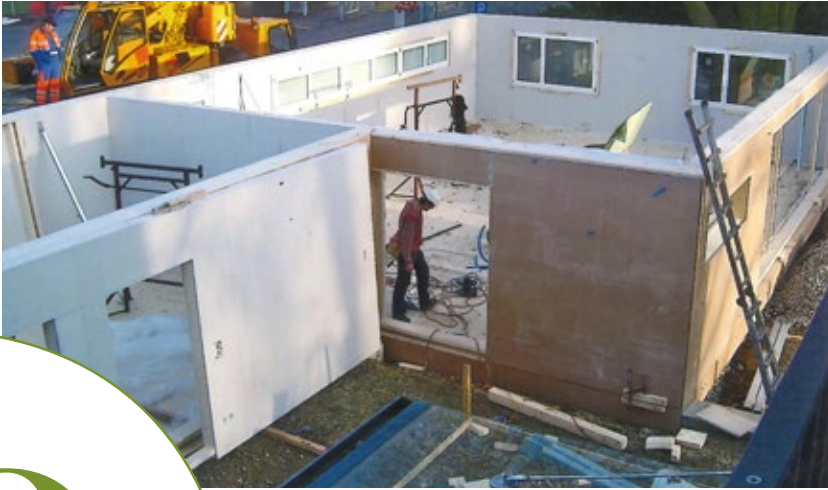
Aufbau des Pavillons, 2010