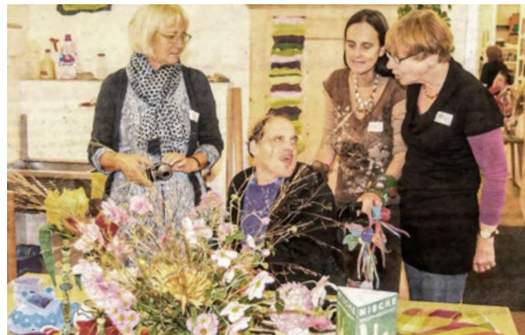
Eröffnung neuer Pavillon, 2010