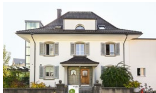
Gartenstrasse 6 . 4665 Oftringen