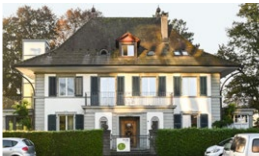
Henzmannstrasse 1 . 4800 Zofingen