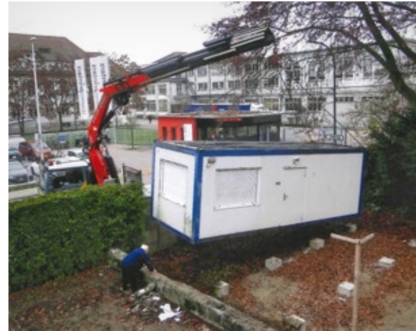
Abtransport des Provisoriums, 2010