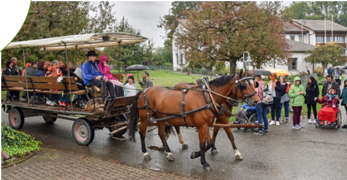
Jubiläumsausflug ins Murimoos, 2022