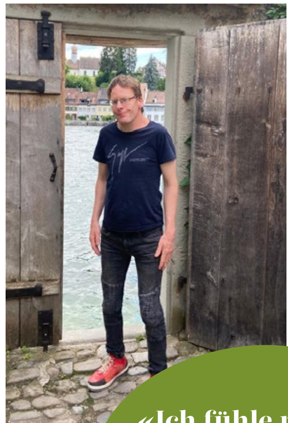
Ausflug nach Stein am Rhein