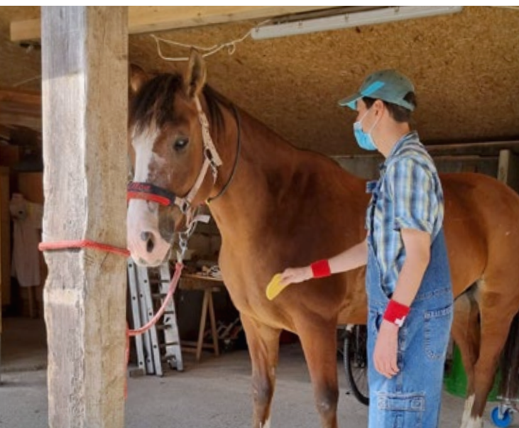
Ausflug zu den Pferden