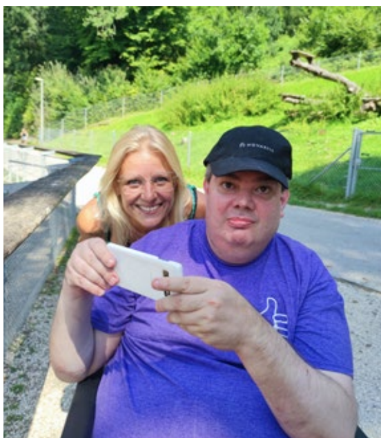
Ausflug ins Roggenhausen

«Ich fühle mich glücklich, wenn ich mich in der Natur bewegen kann.»