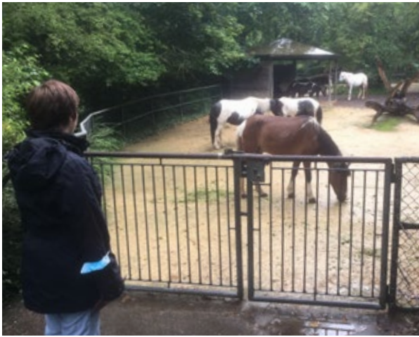
Ausflug in den Basler Zoo