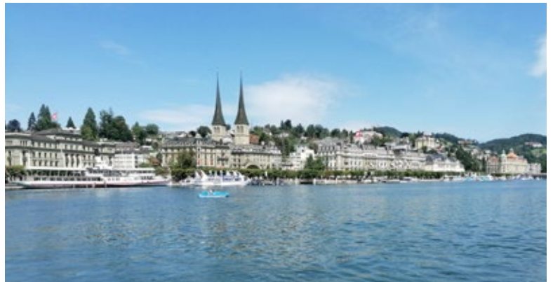
Schiffahrt auf dem Vierwaldstättersee