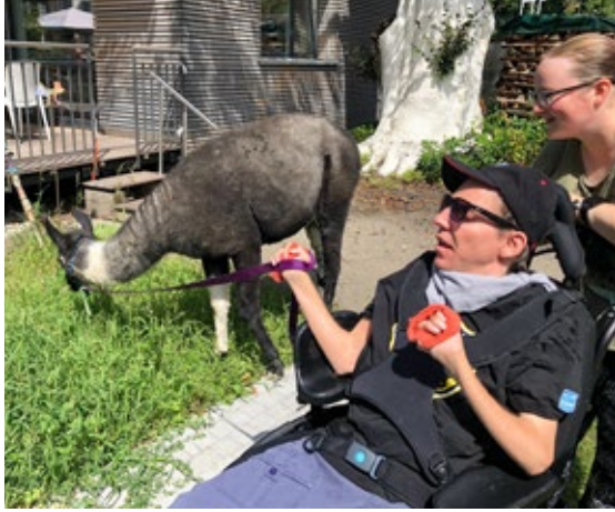
Besuch von Lamas an der Henzmannstrasse