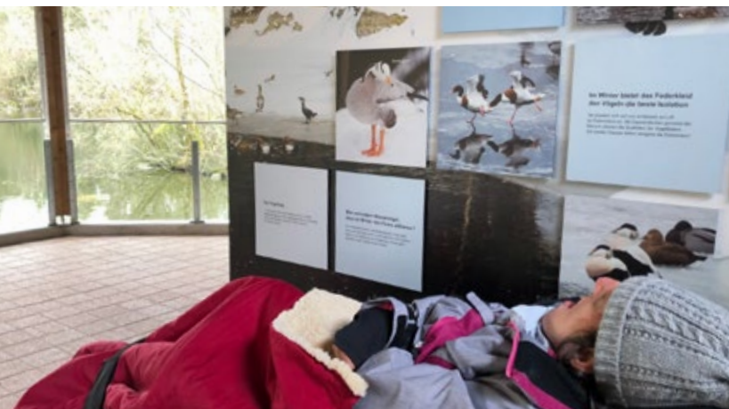
Ausflug in den Natur- und Tierpark Goldau